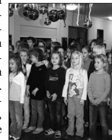
Die Kinder bedankten sich mit einem Lied bei ihren Gästen.