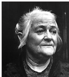
Frauenrechtlerin Clara Zetkin